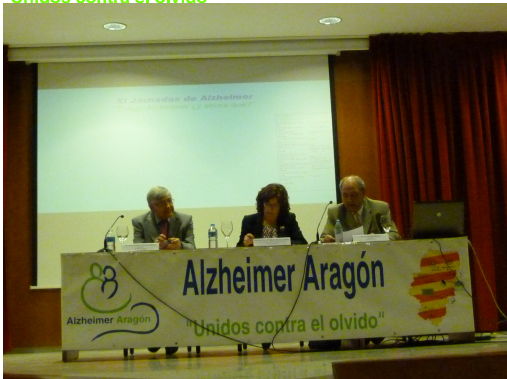
Ciudad Solidaria con el Alzheimer a la Alcaldesa de Teruel